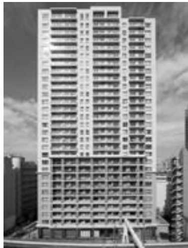
レジディアタワー目黒不動産前