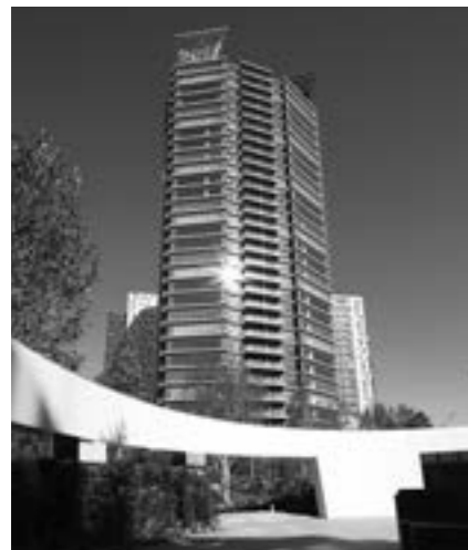
コンフォリア新宿イーストサイドタワー

本投資法人は、東急不動産がプロデュースする都市型賃貸レジデンス「コンフォリア」シリーズを主な投資対象としています。特徴の1つ目は、「東京23区中心の優良資産への厳選投資」です。賃貸住宅需要の増加が見込まれる東京23区に集中投資をしており、平成29年7月末時点では90.5%が東京23区に位置し、最寄駅からの平均徒歩分数も4.9分となっています。特徴の2つ目は、「東急不動産ホールディングスグループのノウハウの活用」です。東急不動産による物件開発のほか、グループ各社が物件情報収集や運営面でサポートしています。このように東急不動産ホールディングスグループの総合力を結集し、安定的な収益確保と着実な運用資産の成長を目指し、投資主価値最大化を図ってまいります。