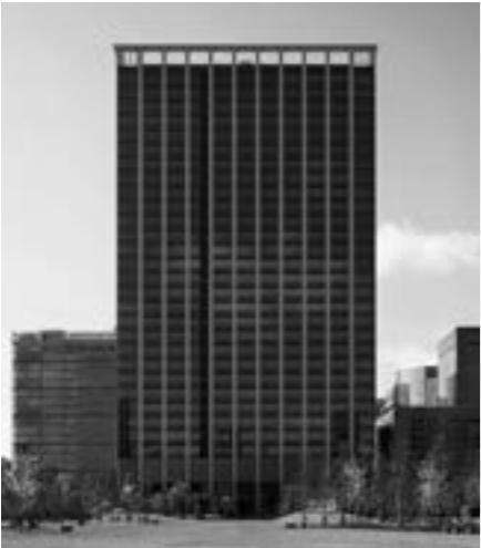
品川シーズンテラス

NTT都市開発リート投資法人は、2002年9月に上場したプレミア投資法人の歴史を引き継ぎ、これまでのメインスポンサーNTT都市開発株式会社が単独スポンサーとなったことを契機に、2021年4月に商号変更を行うと共に運用体制とスポンサーシップを一段と強化しました。 東京経済圏を中心にオフィスとレジデンスを主たる用途とする不動産に分散投資することで、中長期的に安定した収益の確保を図る運用を行っています。今後も、スポンサー・サポートを活用し、ポートフォリオの確実な成長と投資主価値の向上をめざしてまいります。