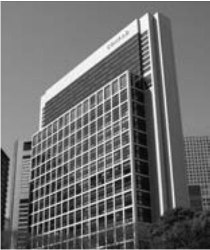
東京汐留ビルディング

本投資法人は、森トラストグループをスポンサーとし、オフィス・ホテルを中核資産とする総合型リートです。資産性・安定性・成長性の追求、スポンサーである森トラストグループとの幅広い連携、堅実な財務戦略といった3つの特徴を活かして運用を行ってきました。今後も、安定的なキャッシュフローを生むオフィスと、成長性が期待できるホテルを中心に中長期的な安定運用を基本とし、安定したインカムゲインの確保、ポートフォリオの着実な成長を目指します。