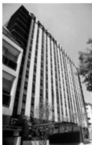
ホテルマイステイズプレミア赤坂

インヴィンシブル投資法人は、ホテル及び住居をコアアセットとする総合型リートです。訪日外国人旅行者の大幅な増加を背景に、2014年5月以降、宿泊需要の拡大が見込まれるホテルセクターを中心にポートフォリオの拡大を進め、2018年9月にはJ-REIT初の海外ホテル物件への投資も実施する等、積極的な外部成長戦略を推進してまいりました。その結果、2021年11月末時点の運用資産総額は取得価格ベースで約5,000億円となり、収益性と安定性の向上に資するポートフォリオのエリア・タイプの更なる分散を実現しています。今後も、スポンサーであるフォートレス・グループのパイプラインを活用した新規物件の取得、及び、積極的なアセットマネジメントによる賃料収入の安定・拡大に努め、投資主価値最大化のための取り組みを実施してまいります。