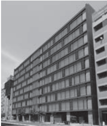
北浜一丁目平和ビル

本投資法人は、2005年3月8日付でクレッシェンド投資法人として東京証券取引所・J-REIT市場に上場し、その後、2010年10月1日付でジャパン・シングルレジデンス投資法人と合併、同時に「平和不動産リート投資法人」に商号を変更致しました。本投資法人は資産の取得から管理・運営、財務戦略に至るまで、スポンサーである平和不動産株式会社の多面的なサポートを受けています。「運用資産の着実な成長」と「中長期的な安定収益の確保」を基本理念に掲げ、テナント需要の強い東京都区部中心のオフィスとレジデンスに投資する複合型リートです。東京都区部に集中投資をする一方、多数の物件に投資をすることでリスクの分散を図っています。投資対象とするオフィスの収益性とレジデンスの安定性の双方を追求し、分配金の安定的かつ着実な成長を目指しています。