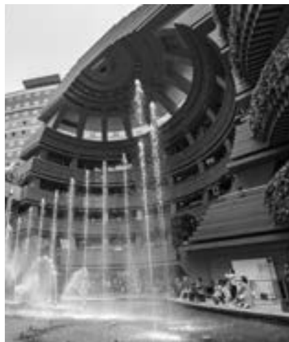
キャナルシティ博多

福岡リート投資法人は、日本初の「地域特化型リート」です。福岡都市圏を中心に、九州・沖縄・山口を投資対象地域とし、デザイン性に優れたエンターテイメント型商業施設、Aクラスのオフィスビル、住居、ホテル、物流施設などを保有・運営しています。九州経済界をリードする有力スポンサー企業の支援・協力を仰ぎながら、「地元ならではの」情報収集力、マーケット感覚、ネットワーク等の強みを活かして投資した不動産を運営することで、中長期的に安定した収益を確保し、将来にわたり安定した分配金を提供し続けるよう努めています。