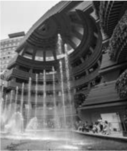
キャナルシティ博多

福岡リート投資法人は、日本初の「地域特化型リート」です。福岡都市圏を中心に、九州・沖縄・山口を投資対象地域とし、デザイン性に優れたエンターテイメント型商業施設、Aクラスのオフィスビル、物流施設、住居、ホテルなどを保有・運営しています。九州経済界をリードする有力スポンサー企業の支援・協力を仰ぎながら、「地元ならではの」情報収集力、マーケット感覚、ネットワーク等の強みを活かして投資した不動産を運営することで、中長期的に安定した収益を確保し、将来にわたり安定した分配金を提供し続けるよう努めています。