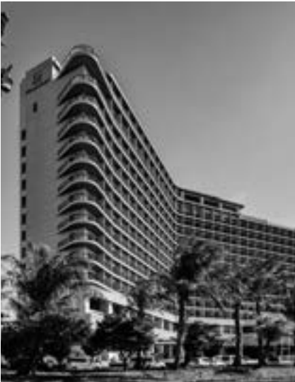
沖縄プリンスホテル オーシャンビューぎのわん

KDX不動産投資法人は、オフィスビル・居住用施設・商業施設を中心として、用途・地域を限定せず様々な不動産に投資を行う総合型REITです。資産規模(取得価格)はJ-REIT第3位となる約1兆2,000億円、物件数は342物件とJ-REIT第1位を誇ります(2025年10月31日現在)。ひと際分散の効いたポートフォリオをベースに、環境変化に即した戦略的な資産入替や、ケネディクスグループのノウハウを活かしたアクティブ運用により収益力の強化を図るとともに、機動的な資本政策を推進することで投資主価値の最大化を目指しています。また、サステナビリティへの取組みを重要な経営課題の一つと位置付けており、省エネルギー化の推進やテナント満足度重視の物件管理等にも注力しています。