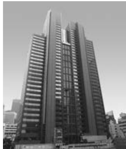
新宿マインズタワー

大和証券オフィス投資法人は、東京主要5区を最重点投資エリアとするオフィス特化型REITです。スポンサーは大和証券グループ本社であり、大和証券グループの経営資源を最大限に活かした運用を行うと共に、金融機関ならではの厳格なガバナンス体制を構築し、コンプライアンスを重視した透明性の高い運用を行います。投資の基本方針については、オフィスビルの特性に基づき、地域・規模などを厳選した投資運用を行い、不動産市況の変化に対応した柔軟な運用を行うことで、将来にわたる安定的な巡航EPSの確保と、投資資産の持続的な成長を図ります。都心立地による内部成長の更なる実現と、開発案件への取組みや競争力を有する物件の取得により、分配金の更なる向上を目指して参ります。