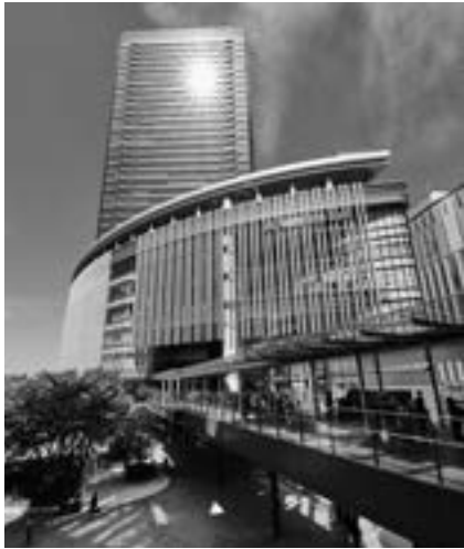
グランフロント大阪

本投資法人は、2004年12月3日に設立され、2005年10月26日に株式会社東京証券取引所不動産投資信託証券市場に上場し、スポンサーである阪急阪神ホールディングスの不動産ネットワーク等を活用できる「関西圏」を中心に投資しています。主な投資対象はスポンサーグループの不動産運営実績のある商業用途及び事務用途の区画を有する不動産としており、その中でも、長年培った運営能力、良質な施設内容及び利便性の高い立地条件によって、安定的な収益が期待できる「商業用途区画」に重点的に投資しています。個別物件の収益性とポートフォリオ全体のバランスを考慮しながら着実な成長を続けるとともに、中長期的に安定した分配による投資主利益の最大化を目指していきます。