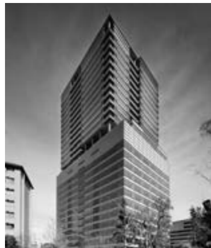
赤坂インターシティ

ジャパンエクセレント投資法人は2006年6月に東京証券取引所に上場したJリートです。上場以来、着実に資産規模を拡大しつつ、安定した利益分配を行ってまいりました。2021年11月末現在、東京圏の大型オフィスビルを中心に35物件、取得価格総額2,825億円の資産を運用しています。主要保有資産は赤坂インターシティ、日石横浜ビル、大森ベルポート等。コアスポンサーはみずほ銀行と親密な総合デベロッパーである日鉄興和不動産と、国内トップクラスの生命保険会社である第一生命。不動産の開発・管理・運営と金融に強みを持つこれら有力なスポンサー企業より多様なサポートを受けることで、今後も継続的に資産規模を拡大し、着実かつ安定した分配金を実現してまいります。