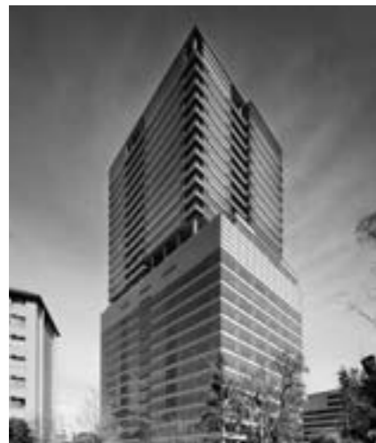
赤坂インターシティ

ジャパンエクセレント投資法人は2006年6月に東京証券取引所に上場したJリートです。上場以来、着実に資産規模を拡大しつつ、安定した利益分配を行ってまいりました。2018年12月末現在、東京圏の大型オフィスビルを中心に31物件、取得価格総額2,735億円の資産を運用しています。主要保有資産は赤坂インターシティ、浜離宮インターシティ、大森ベルポート等。コアスポンサーはみずほ銀行と親密な総合デベロッパーである新日鉄興和不動産と、国内トップクラスの生命保険会社である第一生命。不動産の開発・管理・運営と金融に強みを持つこれら有力なスポンサー企業より多様なサポートを受けることで、今後も継続的に資産規模を拡大し、着実かつ安定した分配金を実現してまいります。