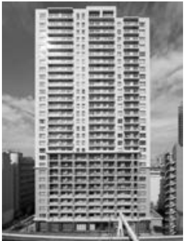
レジディアタワー目黒不動前