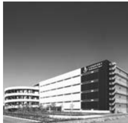
ロジポート川崎ベイ

ラサールロジポート投資法人は、ラサール不動産投資顧問株式会社をスポンサーとし、物流施設を主な投資対象とするJ-REITとして、2016年2月に東京証券取引所に上場しました。東京エリア・大阪エリアを主たる投資エリアとし、物流適地に所在する大規模・高機能な物流施設である「プライム・ロジスティクス」への重点投資を通じて、質の高いポートフォリオを構築しております。また、安定稼働物件への投資に加え、超過収益の獲得を狙う「バリューアッド投資」と呼ぶアップサイドのポテンシャルを有する投資を一定程度組み合わせることで、プラスアルファの収益を獲得する取り組みを行っております。世界有数の不動産投資顧問会社であるラサールグループのグローバルな不動産投資の知見と、日本の物流施設への豊富な開発・投資実績に支えられた運用力を活用して、キャッシュフローと資産価値の長期安定的な成長を通じて、投資主価値の向上を図ってまいります。