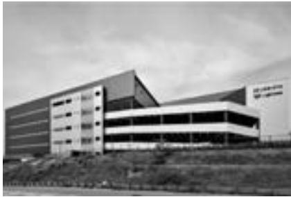
ロジスタ・ロジクロス茨木彩都A棟

三菱地所物流リート投資法人は、日本最大級の総合デベロッパーである三菱地所をスポンサーとし、物流施設を主な投資対象とするリートです。三菱地所の開発・運営力及び豊富な不動産ファンドの運用実績を有する資産運用会社である三菱地所投資顧問の投資・運用力をハイブリッド活用し、投資主価値の最大化を目指します。 また、三菱地所グループの総合力を活かし、不動産投資市場及び物流施設市場を取り巻く環境変化に適応することによって、我が国における物流プラットフォームの一翼を担うとともに、人々の生活を支える物流機能の発展に貢献します。