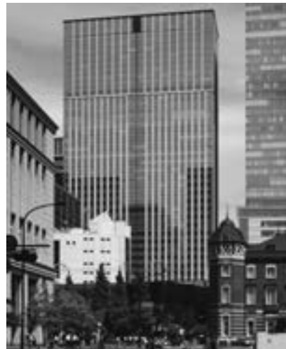
シャングリ・ラ ホテル 東京

本投資法人は、日本の基幹産業へと変革しつつある観光産業に着目し、スポンサーである森トラストの開発力と、森トラスト・ホテルズ&リゾートのホテル運営・マネジメント力に支えられる優良なアセット、すなわち「Trust Quality」が産み出す「Trust Value」を共有する魅力的なホテルアセットに対し重点投資することで、中長期にわたって、安定収益の確保と運用資産の着実な成長を図り、投資主価値の最大化を目指すとともに、かかる基本理念の下での資産運用を通じて、ホテルマーケットの活性化、さらには観光先進国を目指す日本の成長戦略の実現に貢献します。