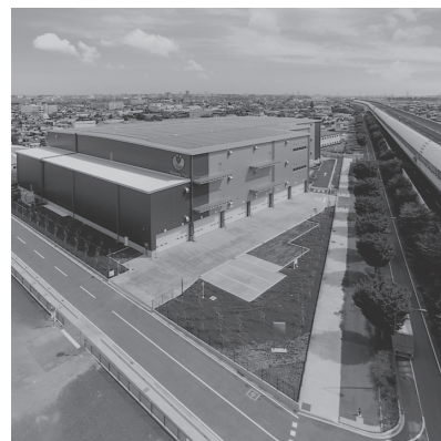
アイミッションズパーク三郷

アパレルや食品等の生活消費関連分野に強みを持つ総合商社の伊藤忠商事をメインスポンサーとし、物流不動産を主な投資対象とする投資法人です。2004年から物流不動産開発を行ってきた老舗デベロッパーとしての知見、物流事業者としての顔、J-REIT運用・管理実績、10万社に及び顧客ネットワークなど、豊富なグループリソース・ノウハウを活用し、本投資法人と伊藤忠グループがともに成長する「拡張的協働関係」を通じて、Eコマースや物流事業拡大の好機を捉えた商社グループならではの成長を図ります。