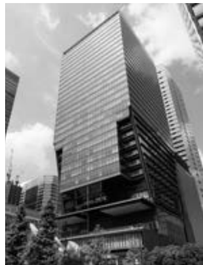
東京サンケイビル

本投資法人は、フジ・メディア・ホールディングスの「都市開発・観光」事業を担うサンケイビルをスポンサーとして2019年3月12日に上場したオフィス系J-REITです。スポンサーサポートにより「人・街・社会を幸せにする。」という理念の下で、ひとりひとりを幸せにする社会の公器としてJ-REIT市場とともに発展することで、中長期的な投資主価値の最大化を目指します。また、スポンサーグループとの間で「資産循環型ビジネスモデル」を構築し、同グループが保持するプラットフォームを最大活用することにより、運用資産の規模拡大及び中長期的な収益の維持・向上を目指します。